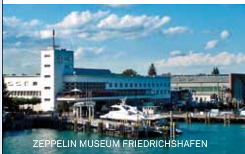
ZEPPELIN MUSEUM FRIEDRICHSHAFEN