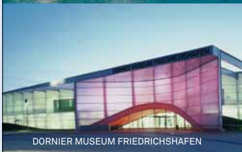
DORNIER MUSEUM FRIEDRICHSHAFEN